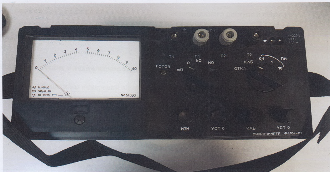
Рисунок 1 - Общий вид микроомметров

Общий вид микроомметров, схема пломбировки от несанкционированного доступа и обозначение мест нанесения знака поверки приведены на рисунке 1 и 2.